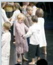
Medgeneracijsko sožitje. (30. 9. 2008)