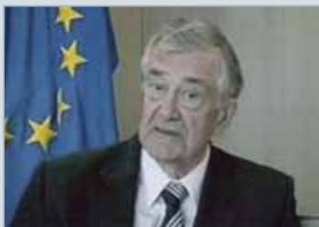
8. Festival za tretje življenjsko obdobje je odmeval prek slovenskih meja v širši evropski prostor - spodbudne besede generalnega sekretarja Sveta Evrope Terryja Davisa. (30. 9. 2008)