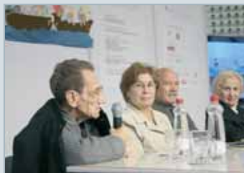
Znane osebnosti v tretjem življenjskem obdobju nam vsako leto razkrijejo svoje poglede in izkušnje. (2. 10. 2008)