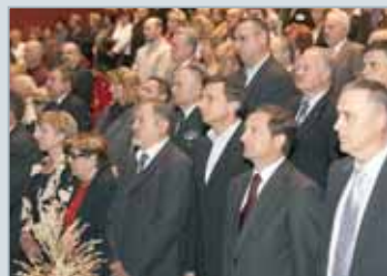
Gostje Otvoritvenega foruma 8. Festivala za tretje življenjsko obdobje. (30. 9. 2008)