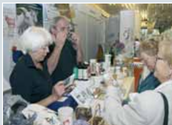
Dragoceni nasveti in stiki s ponudniki izdelkov in storitev za starejše.