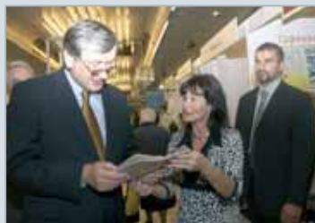
Predsednik države dr. Danilo Türk si je z zanimanjem ogledal, kaj ponuja Festival za tretje življenjsko obdobje. (1. 10. 2008)