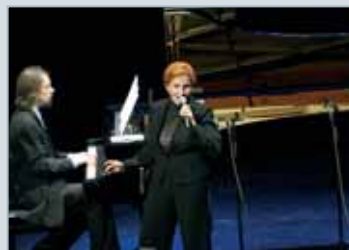
8. Festival za tretje življenjsko obdobje je zaključila Ditka Haberl. (2. 10. 2008)