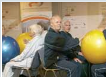
Predstavitve programov za kakovostno preživljanje prostega časa in krepitev telesa.