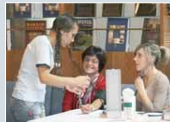
Merjenje krvnega tlaka, ravni sladkorja in holesterola v krvi za vse obiskovalce.