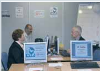
Spoznavanje starejših s sodobno informacijsko tehnologijo.