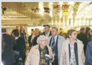
Obiskovalci - željni informacij, debate in razvedrila.