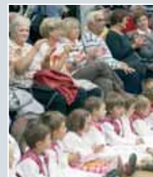
Kulturni program za vse generacije.