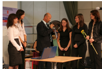
Utrinek z lanskoletne podelitve nagrad

Razpis za najboljše raziskovalne naloge študentov in študentk letos poteka že tretjič. Tako kot raste sam festival, je tudi sodelovanje na natečaju iz leta v leto večje.